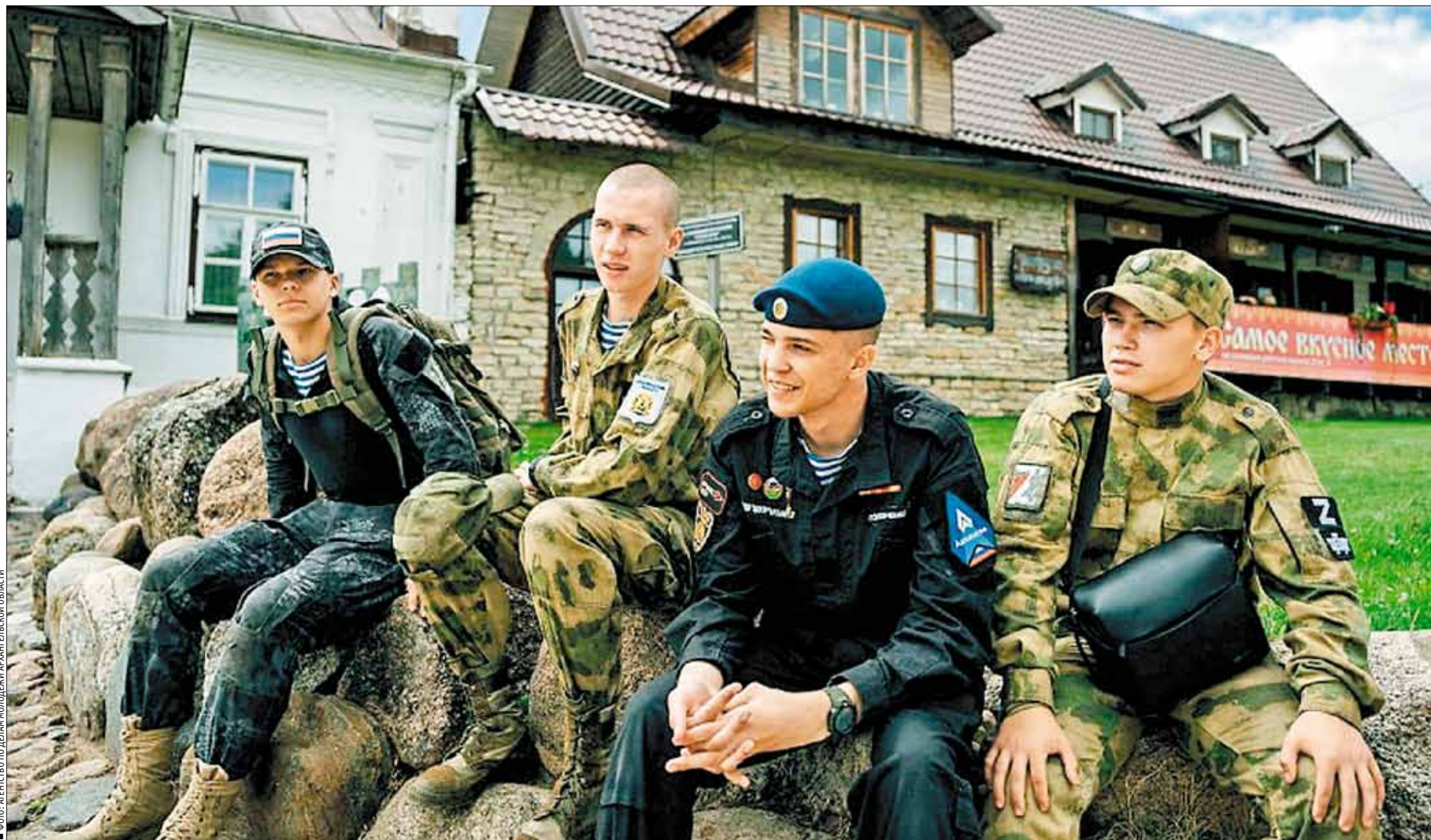
ФОТО: АГЕНСТВО ПО ДЕЛАМ МОЛОДЕЖИ АРХАНГЕЛЬСКОЙ ОБЛАСТИ